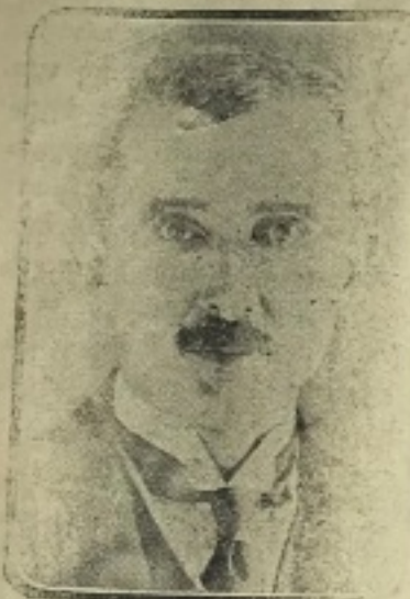
Kıymetli Başvekilimiz İSMET PAŞA H.Z.

Türkiyenin tatmin edilmiş bir devlet olduğuna söylemiştir