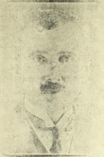
Aziz Cumhuriyetimizin Kıy - metli Başvekili

Büyük millet meclisinin 4 Mart tarihli içtimasında hükümetin' müddeti hitambulan